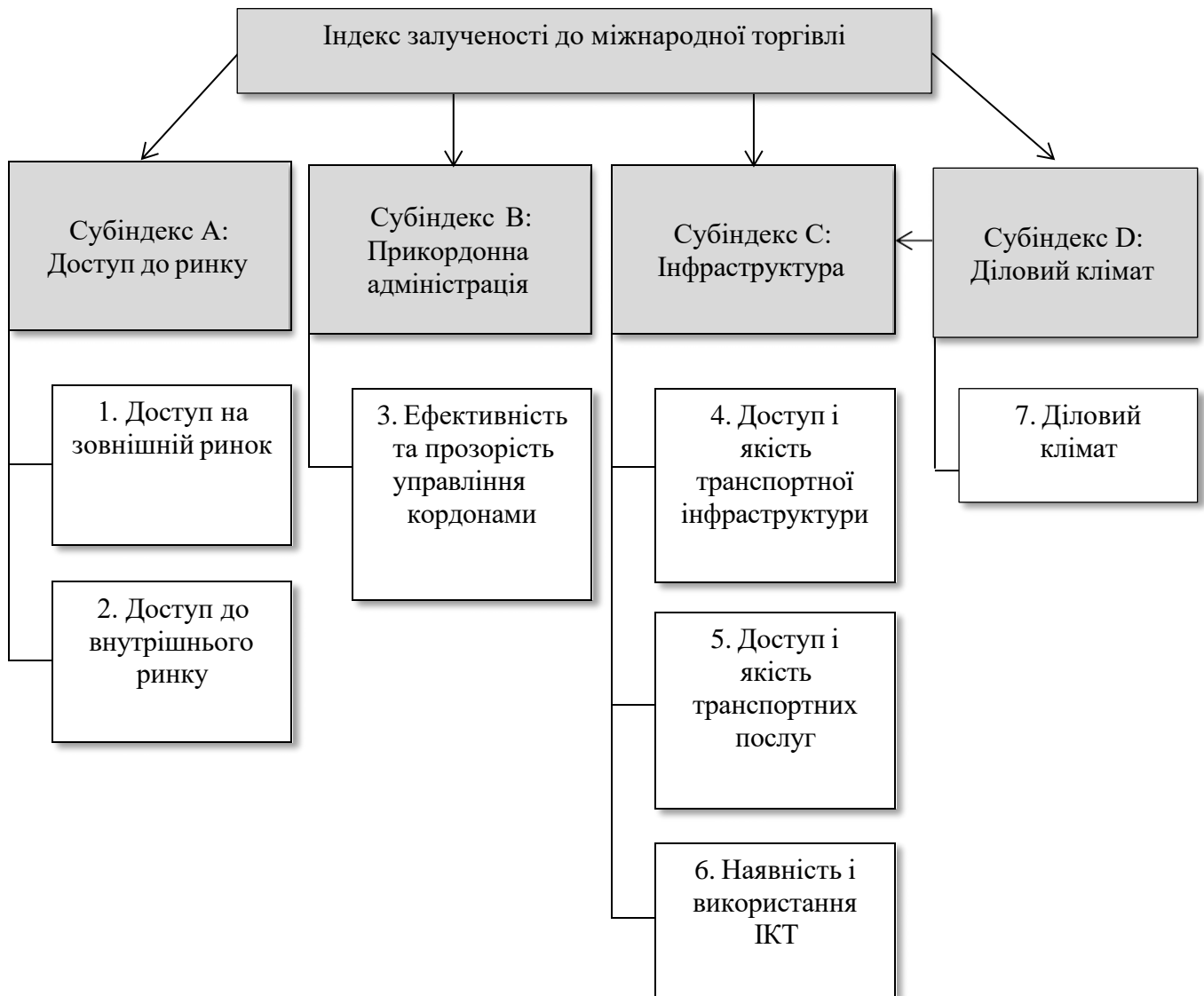
Рис. 1.4. Структура індексу залученості до міжнародної торгівлі

НАПРИКЛАД: Рис. 1.4 (четвертий рисунок першого розділу)