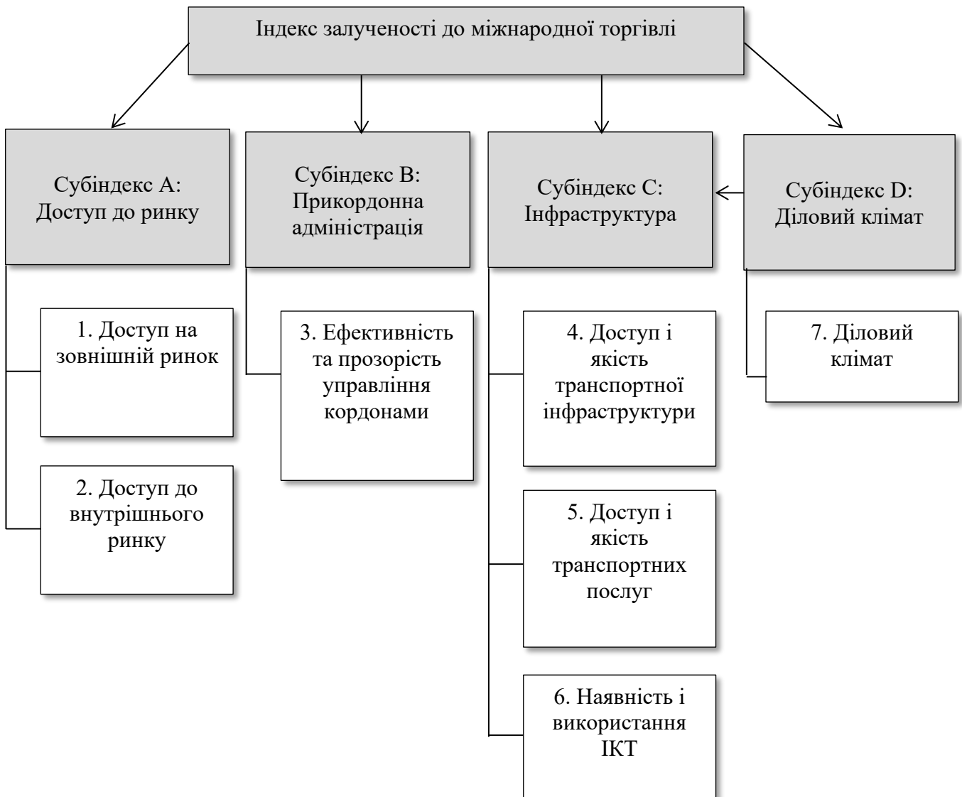
Рис. 1.4. Структура індексу залученості до міжнародної торгівлі

НАПРИКЛАД: Рис. 1.4 (четвертий рисунок першого розділу)